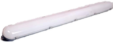
PANTALLA SKY 40 W