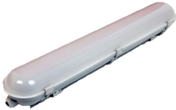
PANTALLA SKY 20 W