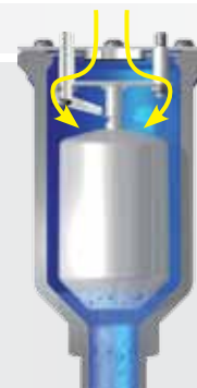
Admisión de grandes cantidades de aire durante el vaciado.