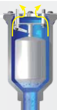
Evacuación de grandes cantidades de aire durante el llenado.