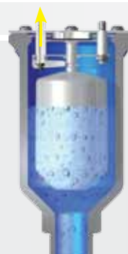
Purga de aire en carga.