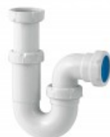
S-31 - Sifón fregadero