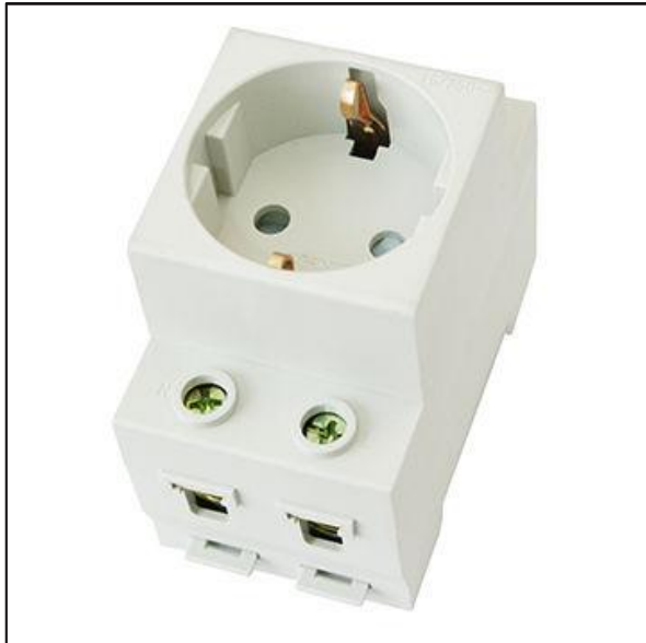
TC-S Toma de corriente modular SECTOR DOMÉSTICO Y TERCIARIO