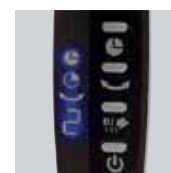
Mandos de control. Indicadores luminosos.