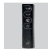
Mando a distancia.